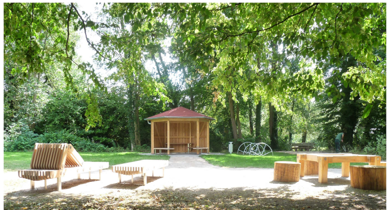
Reisgarten „Mühlenwiese“ in Heiligenrode