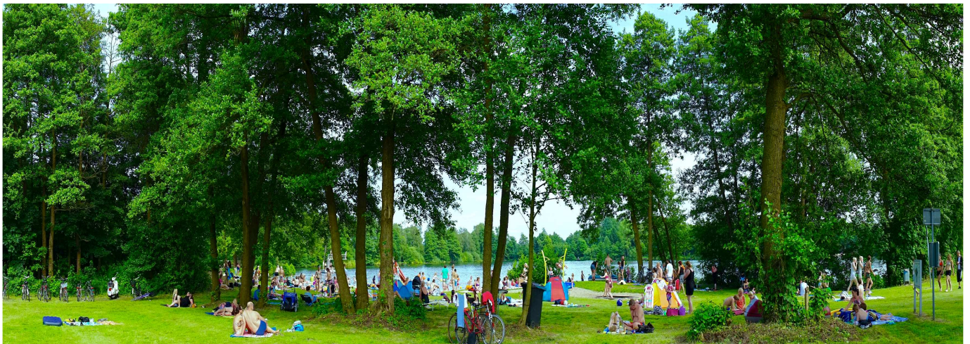
Silbersee in Stuhr

1 EZ im möblierten Appartement (1. Etage) mit Kochnische, DU, WC, R, Autostellplatz, Gartennutzung