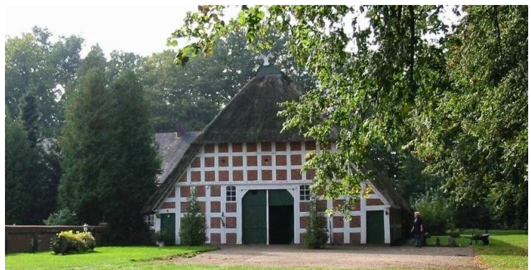
Scheepers Hoff in Groß Mackenstedt

Anzahl der Stellplätze: 100 / Ganzjährig geöffnet