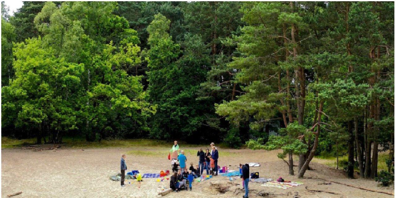
Picknick im Warwer Sand in Fahrenhorst