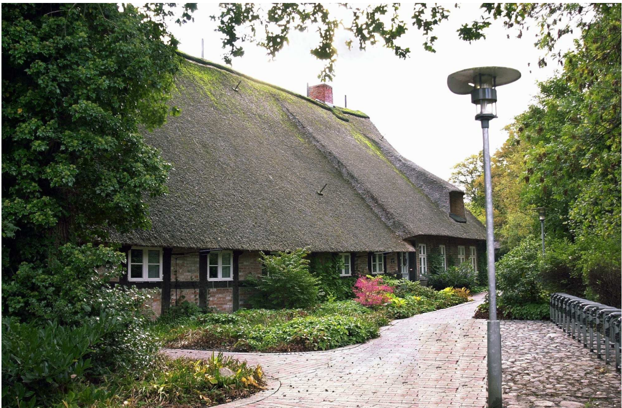
Haus Lohmann in Brinkum

1 moderne 2-Zimmer Nichtraucher-Wohnung im Erdgeschoss ohne Schwellen mit Terrasse Mindestbelegung 3 Tage im Wohnzimmer kann eine 3. Person untergebracht werden Bettwäsche und Handtücher gegen Gebühr, Endreinigung kostet extra Ausstattung: komplett ausgestattete Küche, BAD, WC, TV, kostenfreies WLAN. Stellplatz am Haus.