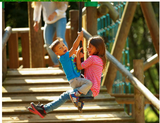
Spielplatz Königshof in Moordeich