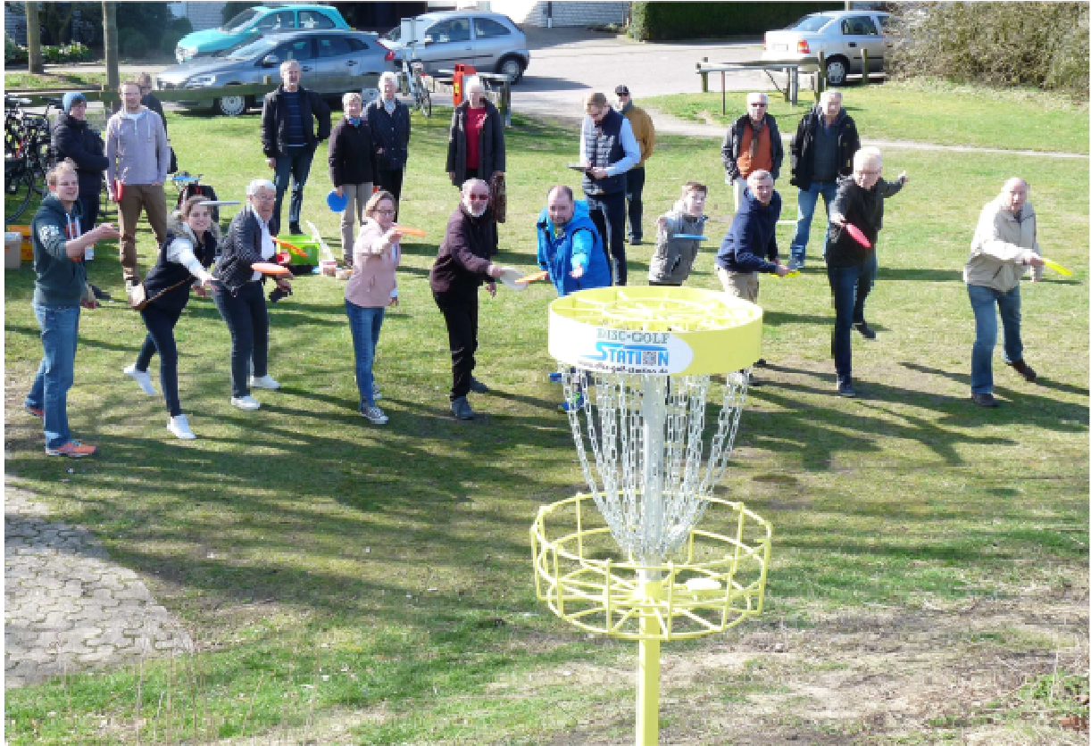
Discgolfanlage in Brinkum